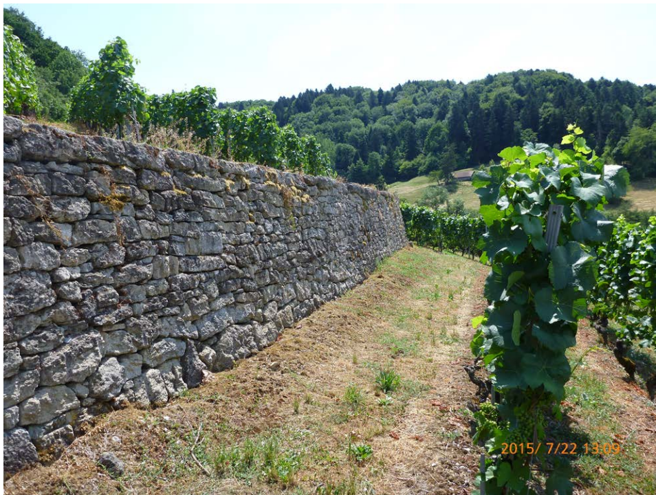
Photos de l'objet 22.07.2015